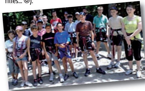
Sortie au Parc Ecureuil en juillet, avec 18 jeunes présents, dont 6 Futurs 6 es et 4 Futurs 2 des . Mais que 2 filles ?

Les deux dernières sorties organisées sont bien représentatives de la diversité de cette salle des jeunes (malgré un manque évident de filles... 😊).