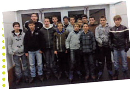
La sortie/soirée patinoire des vacances de la Toussaint a réuni 15 jeunes, (entre 11 et 16 ans) qui se sont retrouvés ensemble autour d'une grande table pour manger un plat de pâtes à la carbonara préparé par eux-mêmes. Ensuite, ils se sont mesurés sur la glace de la patinoire de Clermont-Ferrand jusqu'à minuit. Pas de jambe cassée, pas de fracture ouverte, juste de nombreux éclats de rires, quelques bleus pour les novices et des adresses internet échangées pour les plus grands...

Pour toute question, curiosité, envie de rencontrer des jeunes, etc. la salle est ouverte tous les mercredis et samedis de 14h à 18h pendant la période scolaire, et du mardi au samedi, de 14h à 19h, pendant les vacances.